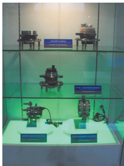
各種ハブユニット