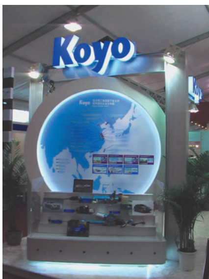
各種電動式パワーステアリングと中国での拠点紹介マップ