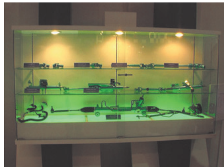
油圧式パワーステアリングシステム, 各種コラム, インタミディエイトシャフト