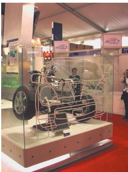
車両統合制御の S B W