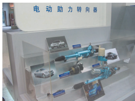
各種電動式パワーステアリング