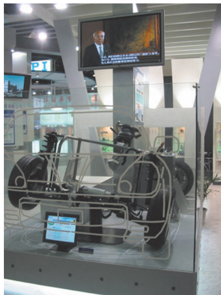
先進技術の車両統合制御の紹介